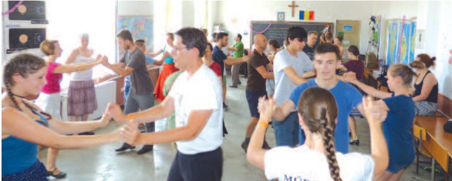
Éjjel-nappal táncoktatás, táncház, folkkocsmá várja a táborlakókat. Pihenésre kevés idő jut