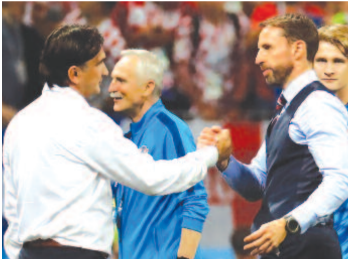
Kapitányi pacsí a 120 perces játék végén: Gareth Southgate (j) gratulál Zlatko Dalicnak

Zlatko Dalic szövetségi kapitány azzal jellemezte a horvát labdarúgó-válogatott karakterét és mentalitását, hogy bár harmadik hosszabbításos mérkőzését játszotta az oroszországi világbajnokságon, egyik játékosa sem akarta, hogy lecserélje az angolok ellen végül 2-1-re megnyert szerdai elődöntőben.