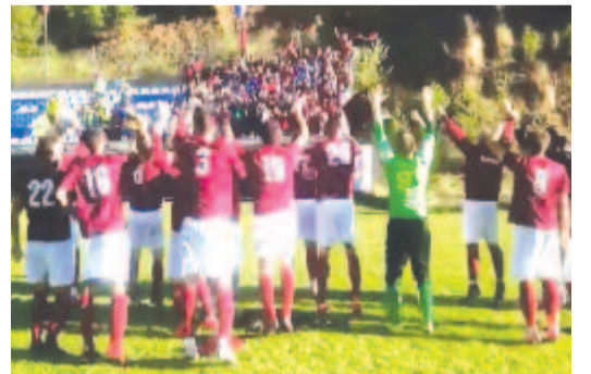
Igy ünnepelte a pályán elért sikert szurkolóival a marosvásárhelyi csapat a Nagyszeben melletti településen

„Örömmel tájékoztatjuk klubunk valamennyi tagját és szurkolóját, hogy a Román Labdarúgó-szövetség illetékes testületei elutasították a Resinár óvását, így a Marosvásárhelyi MSE a következő idénytől a 3. ligában folytatja szereplését” – volt olvasható tegnap a klub közösségi oldalán.